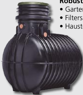
Gartentank mit Domschacht