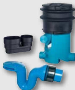
Volumenfilter VF1, Unosiphon und beruhigter Zulauf