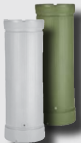
Regensäule 500 L