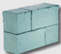
Quadrum Water Wall 330 L