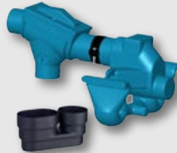
Filtersiphon-Modul und beruhigter Zulauf