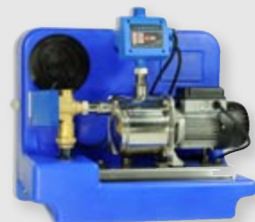
Regenwasser Saugmodul ecoBox duo mit schwimmender Entnahme*