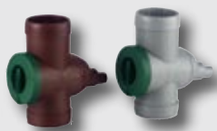
Filtersammler braun/ grau