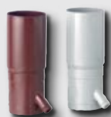
Regensammler braun/ grau