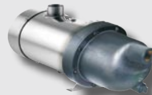
Forta Trio Gartenpumpe

universell einsetzbar als Tauch- oder Saugpumpe, integrierte Steuerung, schaltet die Pumpe automatisch ein/aus.