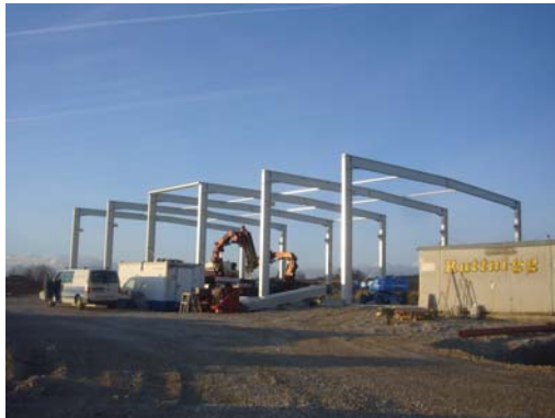
Im Plan: geoCell wird noch ab diesen Sommer in Österreich produziert.

Schon diesen Sommer wird geoCell Schaumglasschotter in am Standort Gaspoltshofen in Oberösterreich produziert. Aber nicht nur Vorzeigebauwerke wie die Vitalisierung des Fronius Vertriebsstandorts in Wels oder der Neubau des Berg Isel Museums in Innsbruck tragen zur großartigen Marktentwicklung des Produktes bei. Die Fülle der Ein- und Mehrfamilienhäuser, welche mit einer soliden Schaumglasdämmung ausgeführt werden, bilden mittlerweile eine starke Basis.